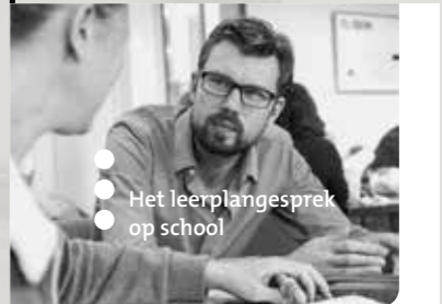
Het leerplangesprek op school

Zorg behalve voor ideeën vooral ook voor de middelen om ze te realiseren. Kijk met een frisse blik naar de organisatie van leertijd, de leeromgeving en de beschikbare bronnen.