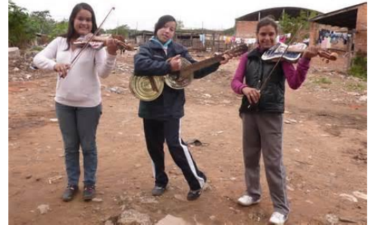
Leden van het Landfill Orchestra

Een bijzondere variant vinden we in Paraguay waar een jeugdig vuilnisbeltorkest, Landfill Orchestra, speelt op instrumenten die gemaakt zijn van weggegooid materiaal van de vuilnisbelt. Een voorbeeldorkest reist over de wereld om te laten zien en horen dat er ook met weinig kosten kwaliteit kan worden ontwikkeld. Ook hier is het 't doel het zelfvertrouwen van de kinderen door samenwerking te vergroten.