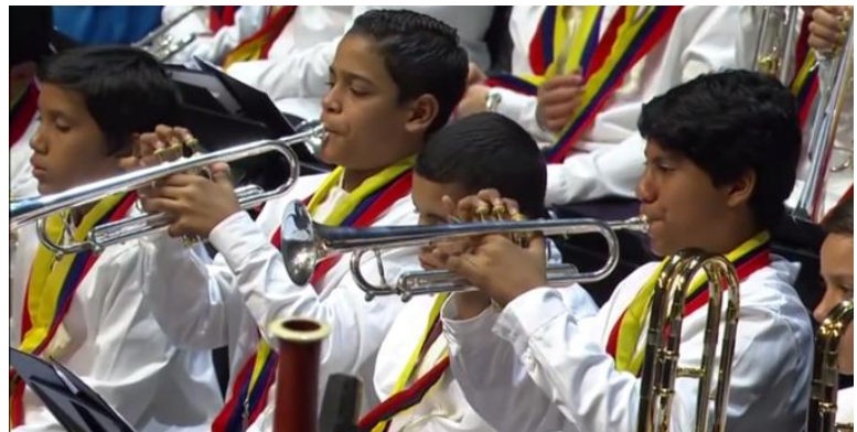
Nationaal Kinderorkest van Venezuela

Ieder gaat constructief met de ander om, ongeachte sekse of leeftijd. Het probleem eenzaamheid , een steeds groter wordend probleem in onze samenleving, geldt minder voor wie een muziekinstrument beheerst. Het is een uitstekend middel om aansluiting te vinden bij anderen die musiceren. Er zijn talloze combinaties mogelijk.