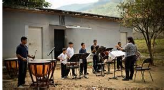
Oefenen in de núcleo

De ouders spelen een belangrijke rol. Zij moeten de kinderen weer ophalen en ook afleveren als er een concert gegeven wordt. Geleidelijk aan ontwikkelde zich dit hele project tot een gigantische samenwerking van kinderen, ouders, muziekdocenten en organiserend personeel. Er ontstonden 'community's, de 'núcleo's': kernen waar geïnfocend en eventueel ook overnacht kon worden. In Venezuela nopen de grote afstanden hiertoe.