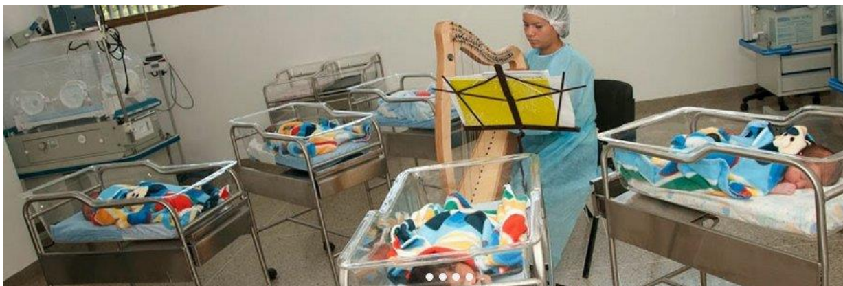
Pasgeborenen krijgen ook al schoonheid en harmonie aangereikt.

Belangrijk is het te beginnen vanaf twee jaar .